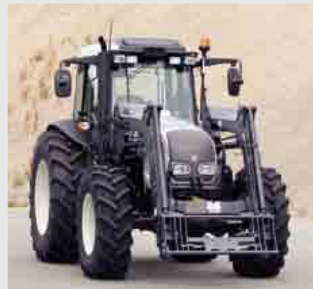
Valtra A-serie med lavt tak.

Den minste modellen i A-serien, A72, leveres kun som Classic. A72 er den rimeligste måten å oppleve en ekte Skandinavisk traktor på. Som alle andre Valtra-traktorer er A72 perfekt for effektivt arbeid på jorden og i skogen – året rundt.