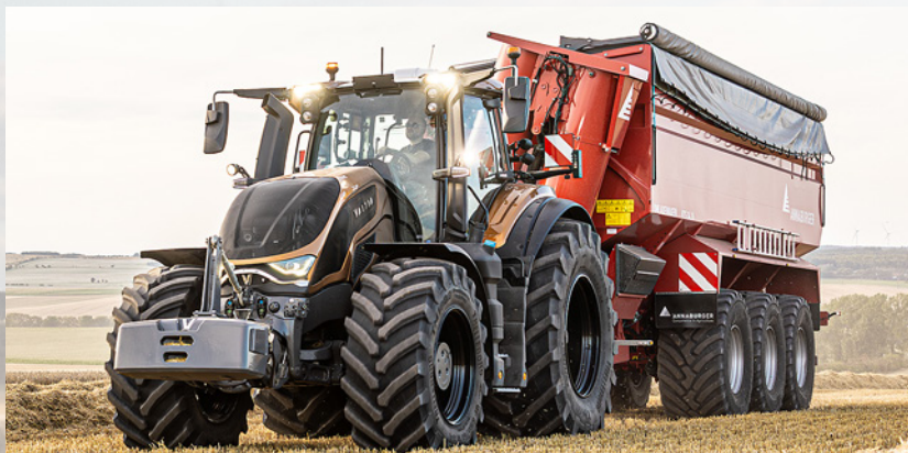
S-serien ble introdusert ved lansering i metallisk brun.

AGCOs trinnløse ML260-transmisjon er også kjent fra forrige S-serie. Du kan starte i et hvilket som helst girområde fra fullstendig stillstand, selv med tung last. Girkasse- og hydraulikkoljer er separate. Mer enn 250 000 enheter av den legendariske girkassen er allerede produsert.