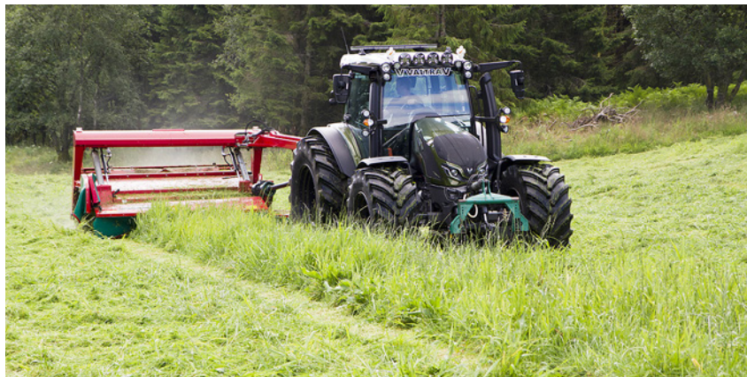
Valtra G135 har den perfekte kombinasjonen av vekt og ytelse for behovet til Helland, som slår gras på bæresvak jord i et område med mye

– Komforten er veldig bra, med fremaksselfjæring, SmartTouch-armen og solide dekk som gir god flyteevne. Traktoren har nok krefter til å kjøre med rundballepresse og slåmaskin. Valtra G135 er rett og slett et fint kompromiss til mine behov, understreker Helland. •