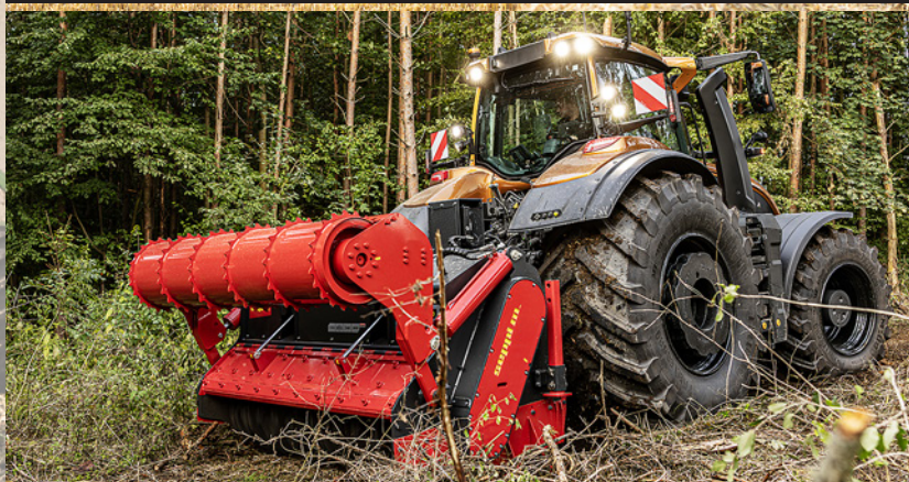
S-serien er tilgjengelig med TwinTrac-systemet med vendbar førerplass og PowerBoost gir full kraft til kraftuttaket også på de større modellene.