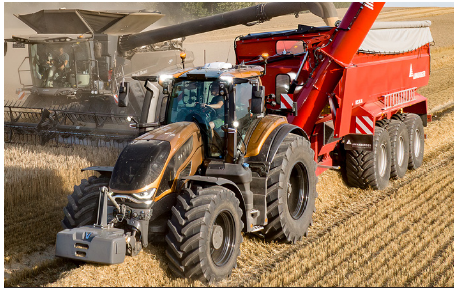
Sjettegenerasjon designdetaljer er spesielt tydelige på designet av motordekselet.

Med det nye førerhuset er sikten og komforten ytterligere forbedret. Helt nye frontlykter er integrert i det nye motordekselet. Førerhuset har også utmerkede arbeidslys, øvre frontlykter og midtmonterte lys.