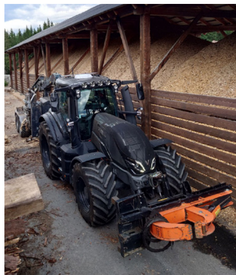
Den nye Q-serien til Vold brukes mye til flishogging. Med 305 hk er den sterk nok til å drive flishoggeren, samtidig som den er kompakt nok til annet gårdsarbeid.

Det har fungert kjempebra, understreker Vold. •