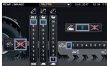
9-tommers berørings-skjerm, store knapper, og alle innstillinger og funksjoner er enkle å forstå.