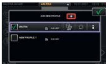
Profiler for fører og redskaper som enkelt kan endres fra hvilken som helst skjerm-meny. Alle innstillingene som endres vil bli lagret under den valgte profilen i armlenet.