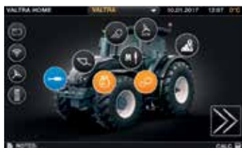
Lett å navigere i menystrukturen.

Valtra SmartTouch har gitt begrepet brukervennlighet en ny mening. Det er mer intuitivt enn din smarttelefon. Innstillingene er lett tilgjengelige med to berøringer eller sveip over skjermen. All teknologi er integrert i det nye brukervennlige formatet: Sporfølging, ISOBUS, Telematikk, AgControl og TaskDoc. SmartTouch er standard på Versu- og Direct-modellene.