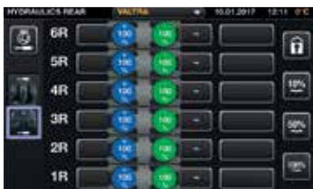
Du kan tilordne hvilken som helst funksjon til ønsket betjeningsorgan – inkludert hydrauliske ventiler foran og bak, trepunktshydraulikk bak eller foran, samt frontlaster.