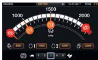
Innstillingene er logiske og enkle å sette opp med sveipe-bevegelser på displayet. Alle innstillinger lagres automatisk i minnet.