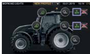
Det er enkelt å konfigurere arbeidslysene med 9-tommers berørings-skjerm. Det er også på / av knapper for arbeidslamper og roterende varsellampe i armlenet.